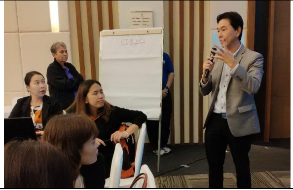
กิจกรรมกลุ่มออกแบบกระบวนการ HL