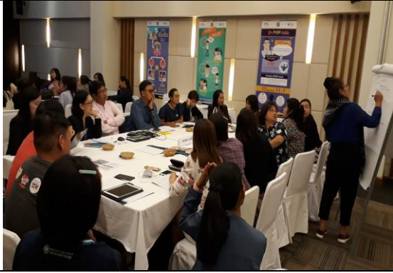
กิจกรรมกลุ่มออกแบบกระบวนการ HL