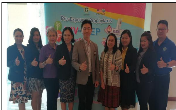
วิทยากรและทีมวิทยากรกระบวนการ