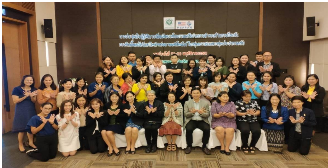
โครงการอบรมเชิงปฏิบัติการเพื่อพัฒนาศักยภาพเครือข่ายการทำงาน ด้านการป้องกันการติดเชื้อเอชไอวี และโรคติดต่อทางเพศสัมพันธ์ในกลุ่มเยาวชนและประชากรหลัก วันที่ 28-30 พฤศจิกายน 2561 ณ โรงแรมแคนทารี จังหวัดพระนครศรีอยุธยา

Clip VDO Health Literacy-HIV AIDS Thailand [28Nov2018]_1