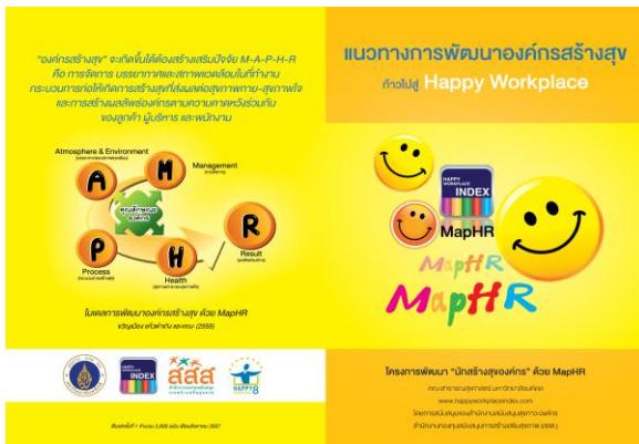
MapHR Model (ขวัญเมือง แก้วดำเกิง, 2555)