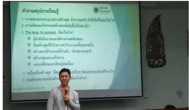
การอบรมหลักสูตร“นักสร้างสุของค์กร”