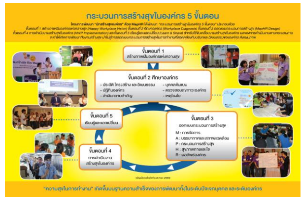
กระบวนการสร้างสุขในองค์กร (ขวัญเมือง แก้วดำเกิง, 2555)