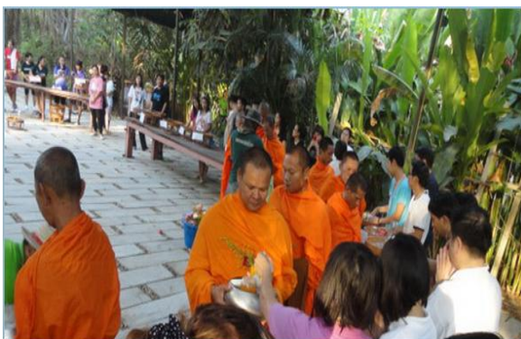
การอบรมหลักสูตร “นักสร้างสุของค์กร”