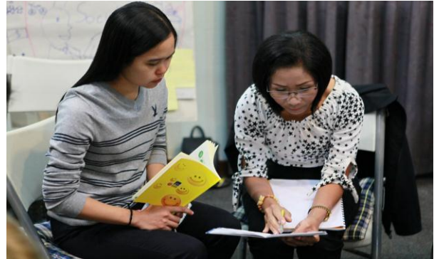
การอบรมหลักสูตร“นักสร้างสุของค์กร”