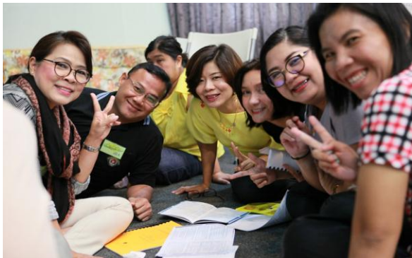
การอบรมหลักสูตร“นักสร้างสุของค์กร”