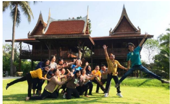
การอบรมหลักสูตร“นักสร้างสุของค์กร”