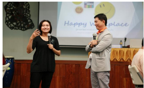
การอบรมหลักสูตร “นักสร้างสุของค์กร”