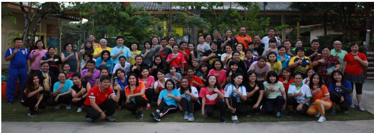
“นักสร้างสุของค์กร” กรุงเทพมหานคร รุ่นที่ 1/2562