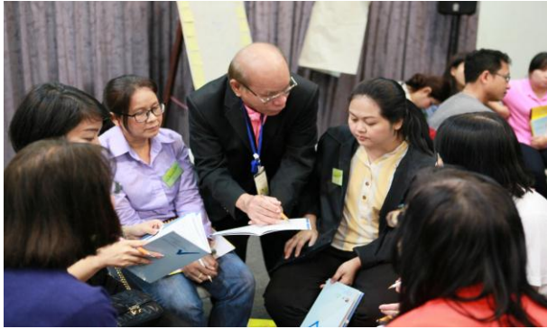
การอบรมหลักสูตร“นักสร้างสุของค์กร”