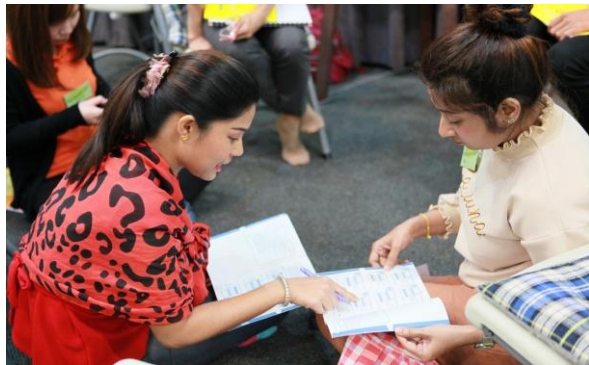
การอบรมหลักสูตร“นักสร้างสุของค์กร”