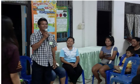
กิจกรรมการเรียนรู้แบบมีส่วนร่วม PLD