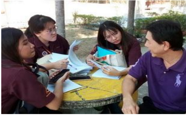
ซักซ้อมความเข้าใจก่อนเก็บรวบรวมข้อมูล