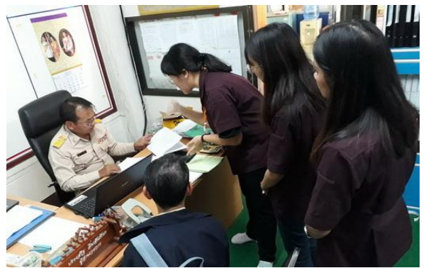
นักศึกษานำเสนอแผนการจัดกิจกรรม