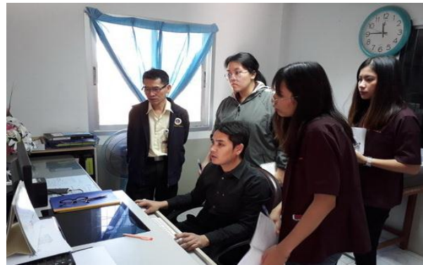
ศึกษาระบบข้อมูลสุขภาพของ รพ.สด.