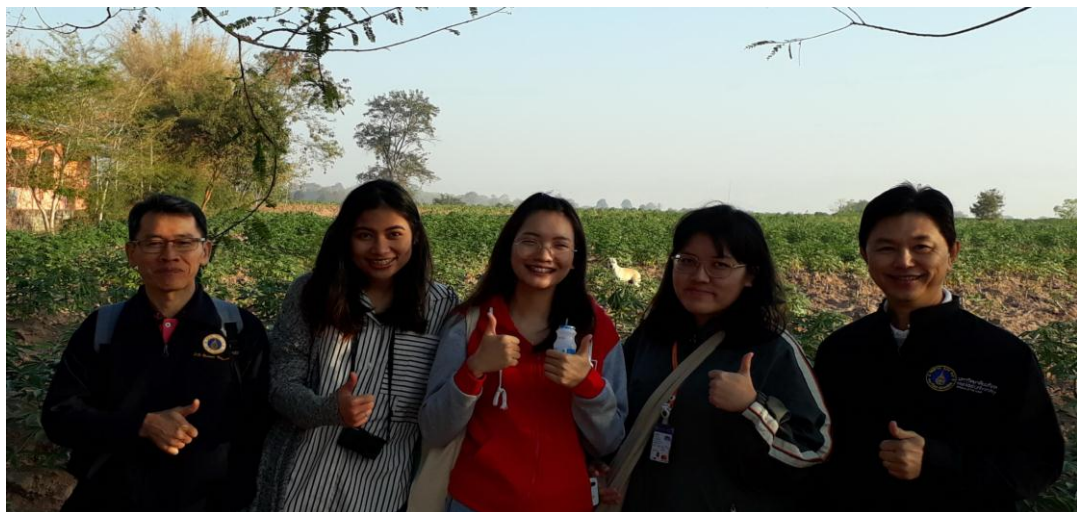
การฝึกปฏิบัติการบูรณาการรายวิชา ก่อนการฝึกภาคสนามระหว่างสาขา วันที่ 28 มกราคม -1 กุมภาพันธ์ 2562 ณ บ้านหนองเบน ตำบลมะเกลือเก่า อ.สูงเนิน จ.นครราชสีมา