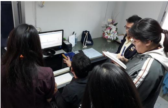
ศึกษาระบบข้อมูลสุขภาพของ รพ.สด.