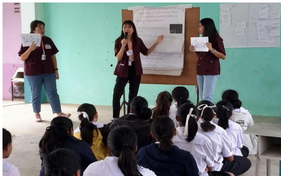
จัดกิจกรรมสร้างเสริมความรู้ด้านสุขภาพ