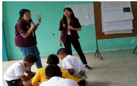
จัดกิจกรรมสร้างเสริมความรู้ด้านสุขภาพ