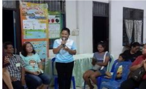
กิจกรรมการเรียนรู้แบบมีส่วนร่วม PLD