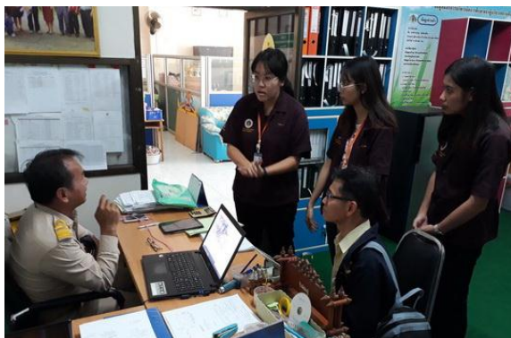
เรียนรู้และไต่ถาม เรื่องข้อมูลสุขภาพในโรงเรียน